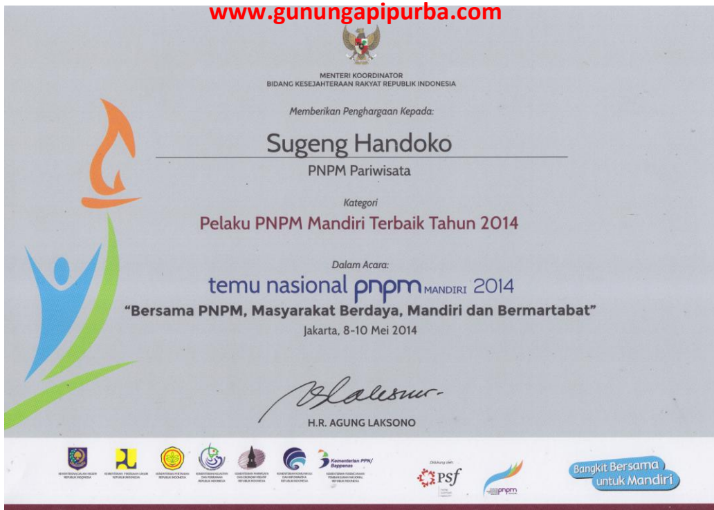
Piagam Penghargaan Pelaku PNPМ Mandiri Terbaik Tahun 2014 dari Kemenkokesra