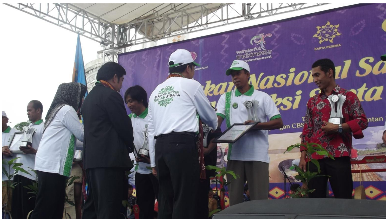
Penghargaan Kelompok Sadar Wisata Berprestasi Tahun 2013 Juara II Tingkat Nasional