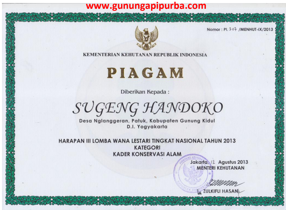
Piagam Penghargaan Juara Harapan III Tingkat Nasional Kader Konservasi Alam Tahun 2013 Kementrian Kehutanan