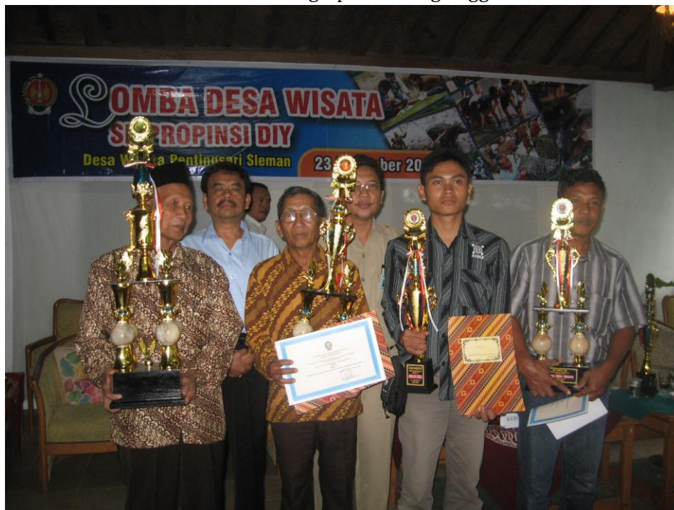
Pengelola Desa Wisata menerima hadiah Lomba Desa Wisata se-DIY pada tahun 2009 di Pentingsari, Sleman.