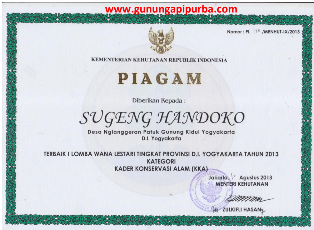
Piagam Penghargaan Terbaik I Tingkat D.I. Yogyakarta Kader Konservasi Alam Tahun 2013 Kementrian Kehutanan RI