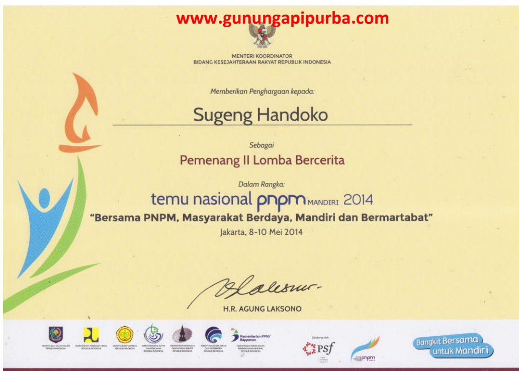
Piagam Penghargaan Pemenang II Lomba Menulis Cerita 1001 Jejak PNPМ Mandiri Tingkat Nasional Tahun 2014 dari Kemenkokesra.

Judul Tulisan " Mendapatkan Ilmu Berharga Berkat Program PNPМ Pariwisata"