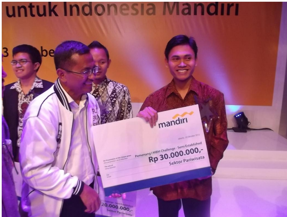
Penghargaan Social Entrepreneur Bidang Pariwisata oleh Menteri BUMN dalam rangkaian acara Lomba MBM Challenge oleh Bank Mandiri