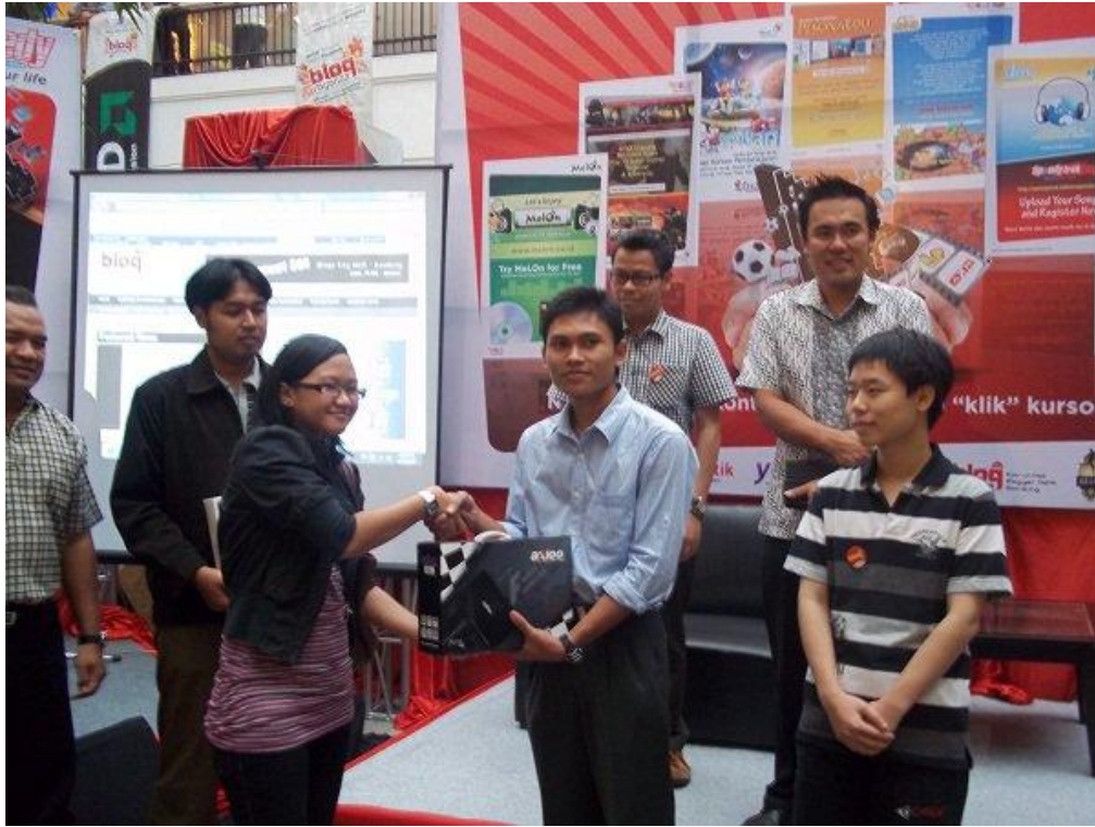
Penerimaan Hadiah Lomba Festival Blog 2010 di Braga City Walk Bandung. Juara II Tingkat Nasional dari 1.027 Peserta se- Indonesia. Blog berisi media marketing Kawasan Ekowisata Gunung Api Purba Nglanggeran.

Judul Tulisan : “Dengan Blog, Potensi Desaku Kutunjukkan kepada Dunia”