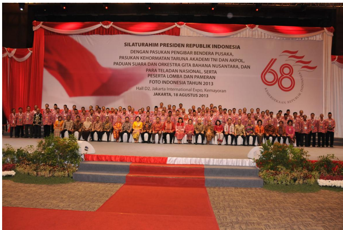
Acara saat silaturahmi dengan Presiden sebagai Kader Konservasi Teladan tahun 2013