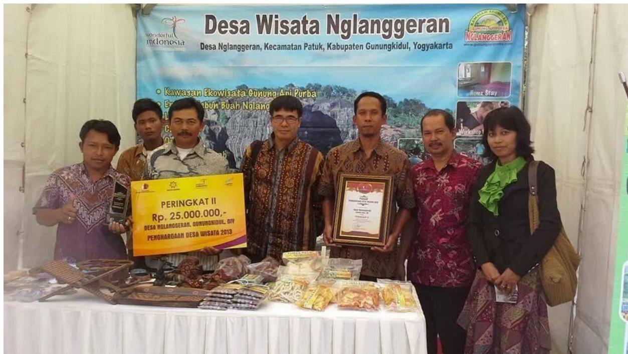
Penghargaan Desa Wisata Tahun 2013 Juara II Tingkat Nasional