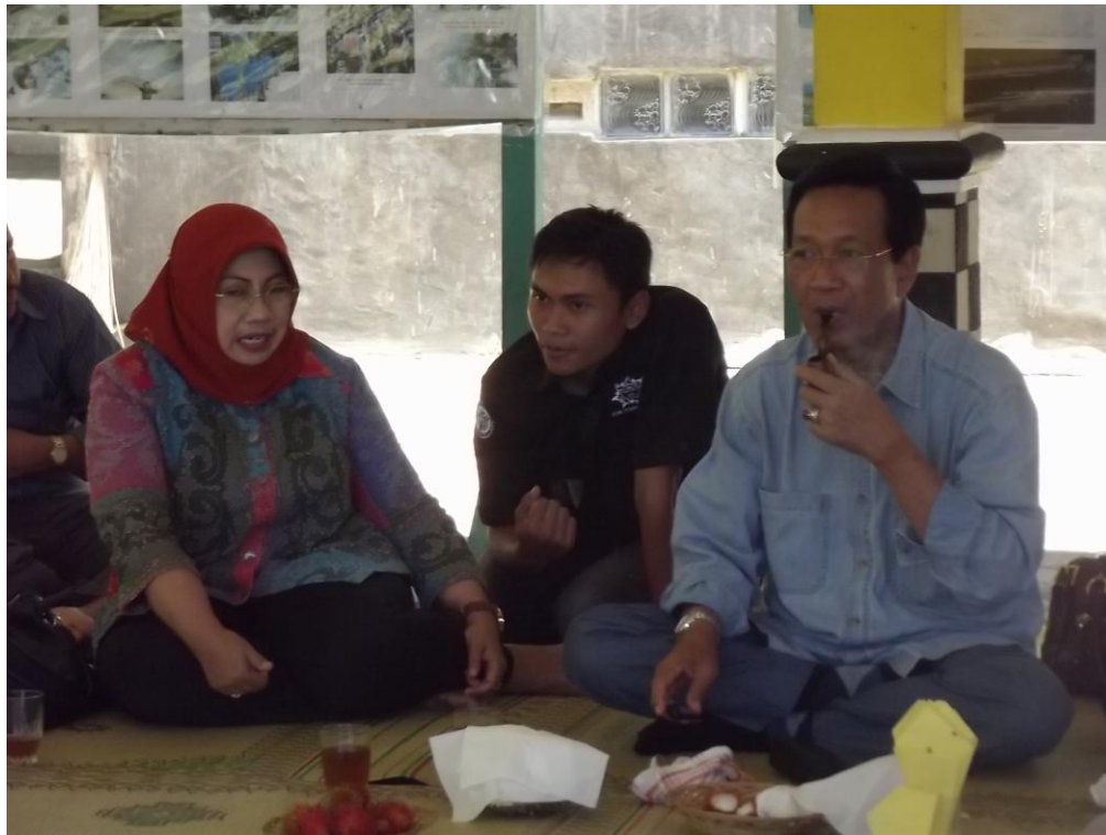
Diskusi dengan Bupati Gunungkidul dan Sri Sultan HB X terkait pembangunan Embung Kebun Buah di Pendopo Kalisong