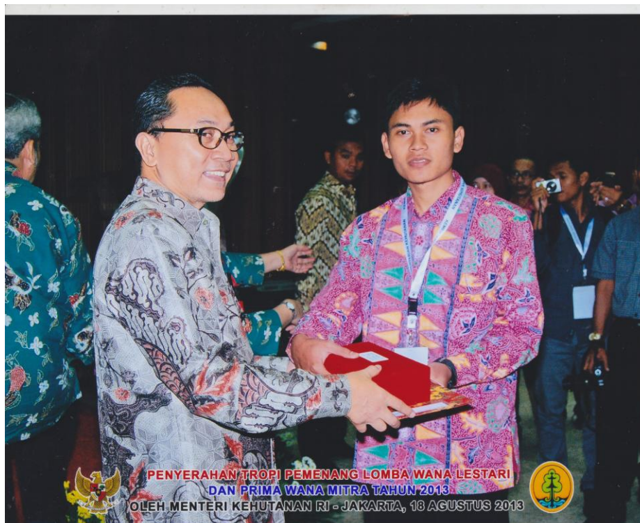
Penghargaan Kader Konservasi Alam Tingkat Nasional 2013 Kementerian Kehutanan