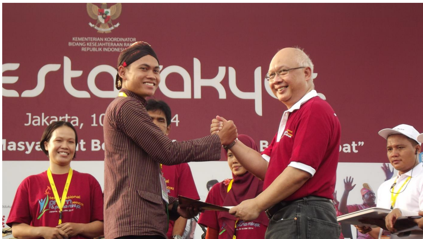
Penghargaan Pelaku Program Nasional Pemberdayaan Masyarakat (PNPM) Mandiri Terbaik 2014 dari Kemenkokesra