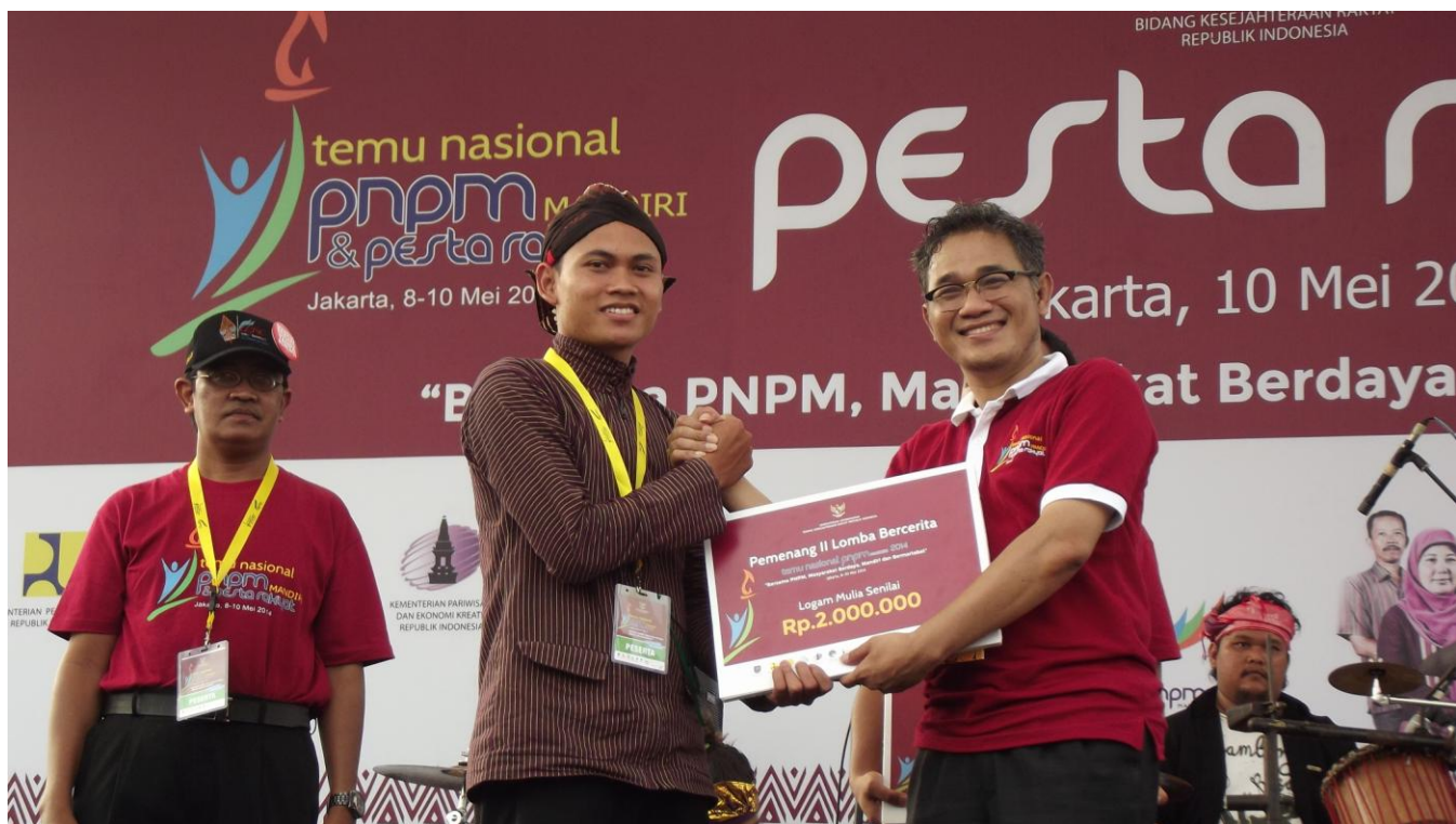
Penghargaan Pemenang II Lomba Menulis 1001 Jejak PNPM Tingkat Nasional 2014